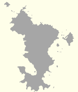
Maoré (non enquêtée)